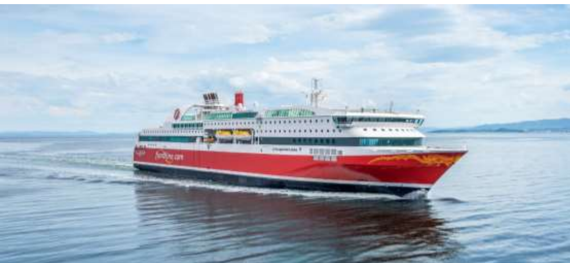
ฟยอร์ด लाईน (fjord Line)

จากนั้นนำทุกท่าน ล่องเรือสำราญ ฟยอร์ด लाईน (fjord Line) ชมทัศนียภาพอันงดงามระหว่างเมืองเบอร์เกน ประเทศนอร์เวย์ สู่เมือง เฮิร์ทชัลส์ (Hirtshals) ประเทศเดนมาร์ก ตลอดการเดินทาง ท่านสามารถผ่อนคลายและชาร์จพลังอย่างเต็มที่ พร้อมเพลิดเพลินกับมื้ออาหารแสนอร่อยในหลากหลายร้านอาหารบนเรือ ที่พร้อมให้บริการทั้งอาหารนานาชาติและเมนูพิเศษสไตล์สแกนดิเนเวีย