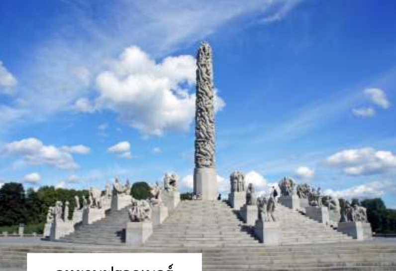
อุทยานฟรอกเนอร์ (Frogner Park)