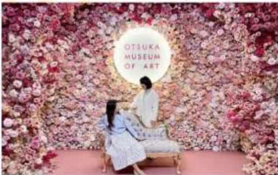
VISIT OTSUKA MUSEUM OF ART

ดื่มด่ำกับโลกแห่งศิลปะ: "พิพิธภัณฑ์ศิลปะ โอทสึกะ" พิพิธภัณฑ์ขนาดใหญ่ที่สุดในญี่ปุ่น ที่รวบรวมผลงานศิลปะตะวันตกชิ้นเอกกว่าพันชิ้นจากทั่วโลก มาให้คุณได้สัมผัสประสบการณ์ศิลปะอย่างใกล้ชิด ผ่านการจำลองผลงานด้วยเทคนิคพิเศษ เพลิดเพลินกับการเดินชมผลงานศิลปะระดับมาสเตอร์พีซ จากศิลปินชื่อดังทั่วโลก อาทิ ไมเคิลแองเจโล, โมเนต์, และดา วินชี