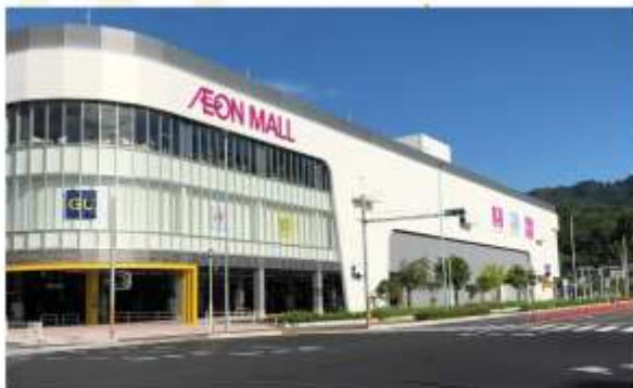
FREE SHOPPING AT AEON MALL KOCHI

ปิดท้ายวันด้วยการช้อปปิ้ง "อิจิออนบอสสึ" ที่ใหญ่ที่สุดในโคจิ ครอบร้านค้าแฟชั่นแบรนด์ดังของญี่ปุ่น และร้านอาหารหลากหลายสไตล์ เดินเล่นสบายในบรรยากาศทันสมัย มีทั้งโซนซูเปอร์มาร์เก็ต คาเฟ่ และของฝากท้องถิ่น ครบจบในที่เดียว