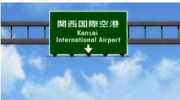
TRNF TO KANSAI INTERNATIONAL AIRPORT

อีสรະ-อาหารค่ำตามอีรออาศัย (ไม่รวมในรายการ)