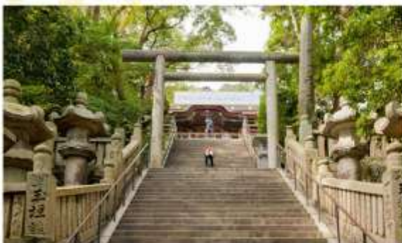
VISIT KOTOHIRA-GU SHRINE

"ศาลเจ้าโคโตะฮิระกุ" หรือ "คอบิระซัง" เป็นศาลเจ้าชินโตที่มีชื่อเสียงและเก่าแก่ ในเมืองโคโตะฮิระ จังหวัดคากาวา ที่ชาวเรือเคารพนับถือ และเป็นหนึ่งใน 88 สถานที่แสวงบุญบนเกาะชิโกกุ ซึ่งมีนับโคชินกว่า 1,368 ขึ้นสู่ศาลเจ้าหลักที่อุทิศให้กับเทพเจ้าแห่งทะเล การเกษตร และโชคลาภ