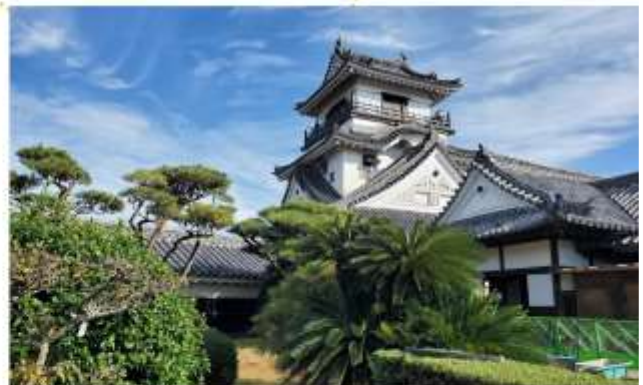
VISTI KOCHI CASTLE