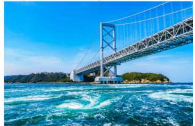
VISIT UZU NO MI CHI (WALK WAY)