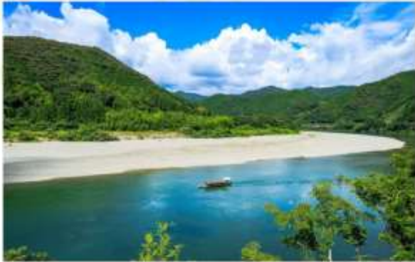
TRNF TO HIDAKA VILLAGE TAKE YAKATABUNE