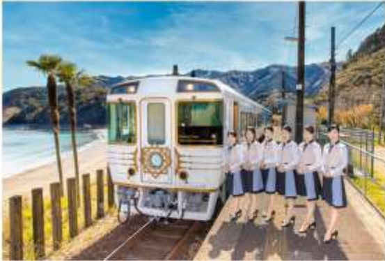
TAKE SHIKOKU TOSA TOKI NO YOAKE NO MONOGATARI