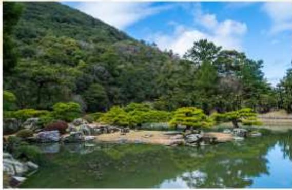
VISIT RITSURIN GARDEN