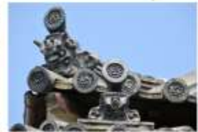
VISIT UDATSU TOWN