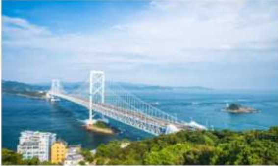
TRNF TO NARUTO