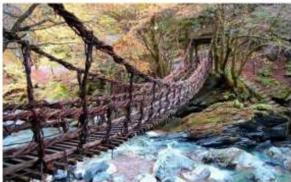
VISIT IYA KAZUIRABASHI BRIDGE

สะพานแขวนเตาวัลย์อายุกว่าพันปี "อิยะ โนะ คาซุระบาชิ" แห่งหุบเขาอิยะ หนึ่งในสามสะพานโบราณที่สุดของญี่ปุ่น สะพานไม้ที่ทอดผ่านกลางธรรมชาติอันเขียวชอุ่มและสายน้ำใส ทำกายความกล้าให้ก้าวข้ามก้าวข้าม พร้อมตื่นตากับวิวสุดตระการตาแบบที่หาที่ไหนไม่ได้