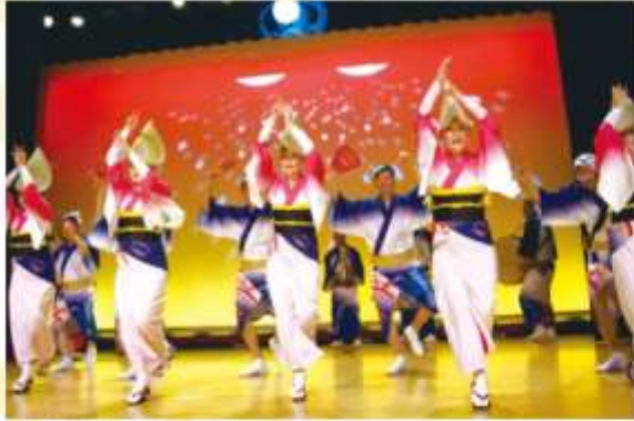
VISIT AWA ODORI KAIKAN