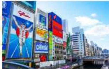
TRNF TO OSAKA FREE SHOPPING AT SHINSAIBASHI