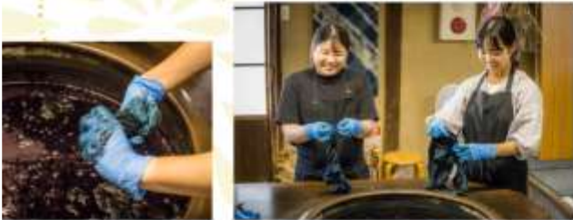
MAKE INDIGO DRING

เชิญชวนคุณมาสัมผัสกับความงามของสีครามธรรมชาติ ผ่านกิจกรรมทำ "ผ้ามัดย้อม" สร้างสรรค์ผลงานผ้าที่เป็นเอกลักษณ์ของคุณเอง และเรียนรู้ประวัติศาสตร์อันยาวนานของการย้อมผ้าครามในญี่ปุ่น และนำกลับบ้านเป็นของที่ระลึกสุดพิเศษ