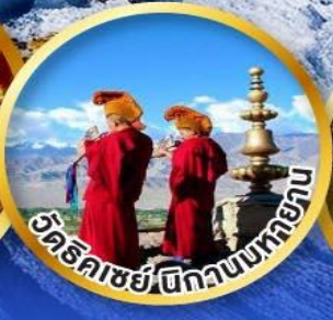
วัดธิคเซย์ตีกวางบเทยกา