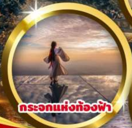
กระเอกแห่งท้องฟ้า