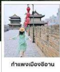
กำแพงเมืองซีอาน