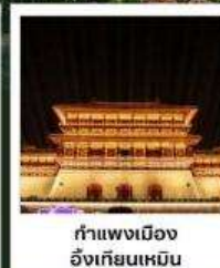
กำแพงเมือง อี้เกียนเหมิน