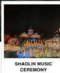
SHAOLIN MUSIC CEREMONY