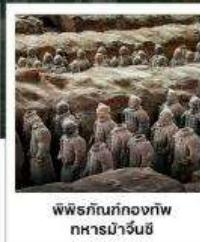
พิพิธภัณฑ์กองทัพทหารม้าจีน