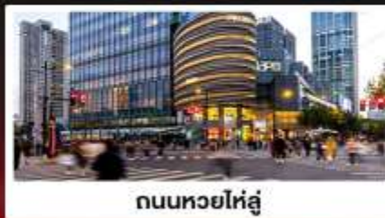
ถนนหวยไห่ลู่