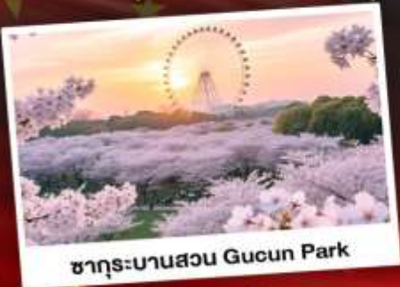
ซากุระบานสวน Gucun Park